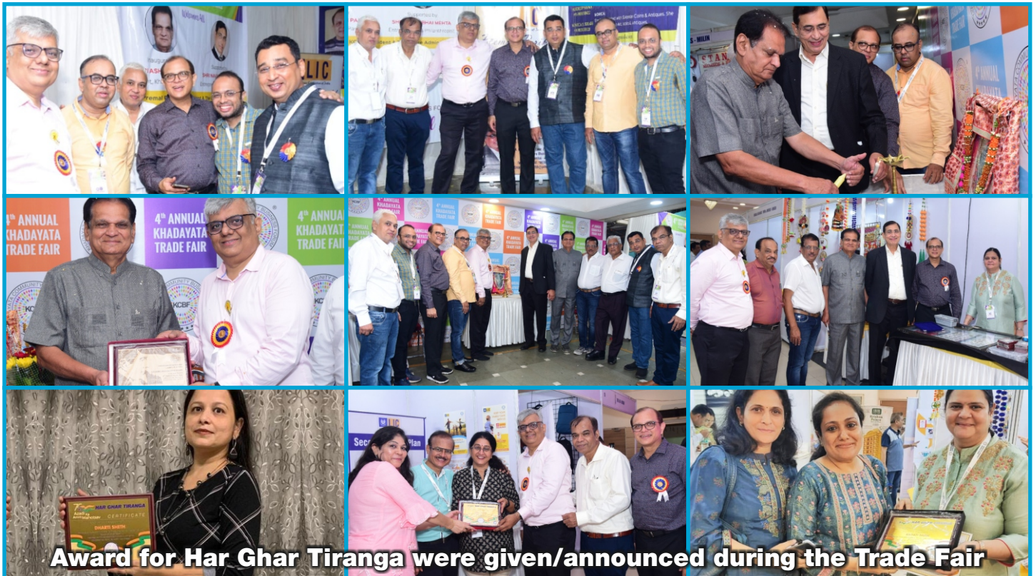
Award for Har Ghar Tiranga were given/announced during the Trade Fair

All The Members Of The Community And The Visitors For Their Support & Encouragement